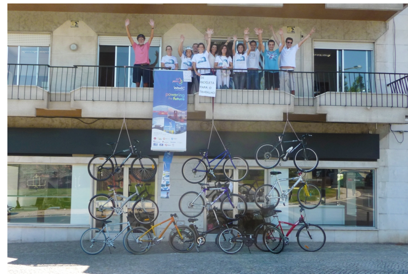
15 – 50 trabalhadores - Offshore Renewables – 596 votos