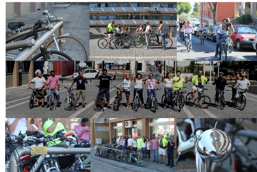
Associações Ensino Superior - AE ISEL - 96