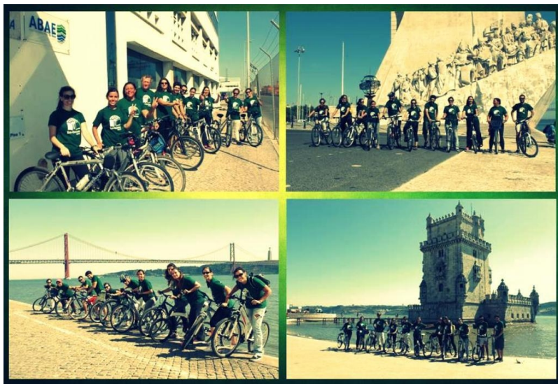
< 15 trabalhadores – ABAE -584 votos