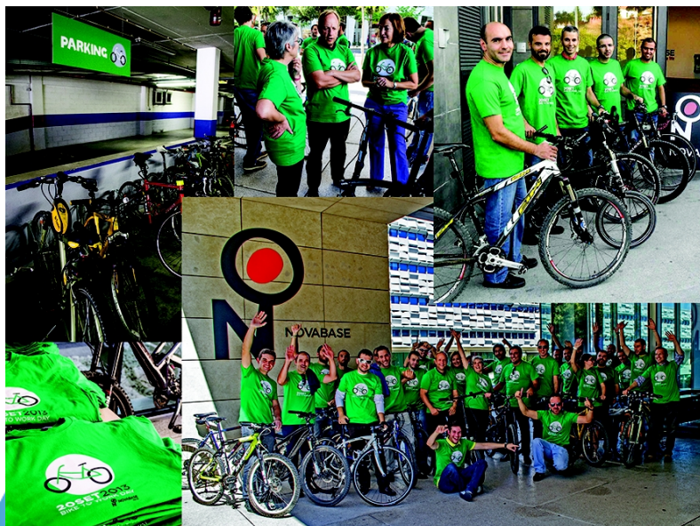
> 50 trabalhadores – Novabase - 780