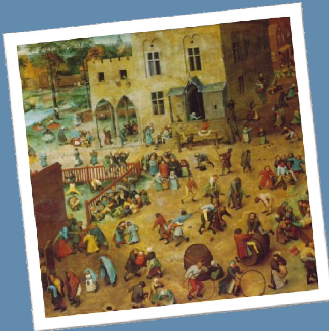
Pieter Bruegel: Children's Games (1560)