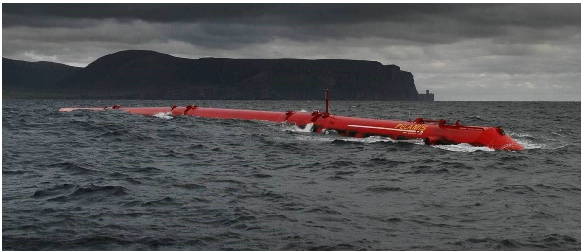
Figura 2 - Conversor de energia das ondas PELAMIS, em teste na Escócia. https://commons.wikimedia.org/w/index.php?curid=4859717