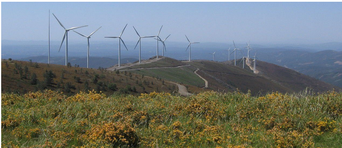
Figura 3 - Parque eólico na Serra da Lousã, Portugal. https://commons.wikimedia.org/w/index.php?curid=6912026